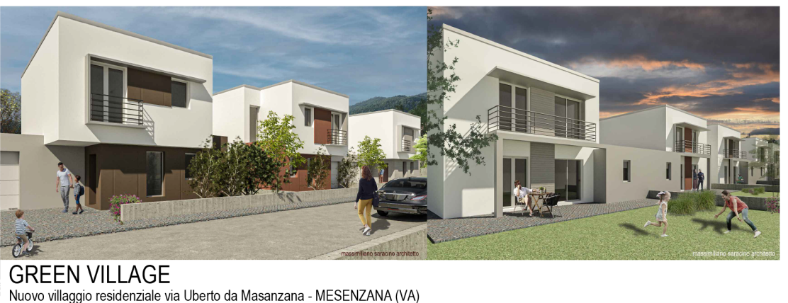
GREEN VILLAGE Nuovo villaggio residenziale via Uberto da Masanzana - MESENZANA (VA)